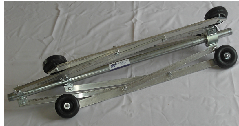
Smallest diameter / kleinsten Durchmesser / kleinste diameter