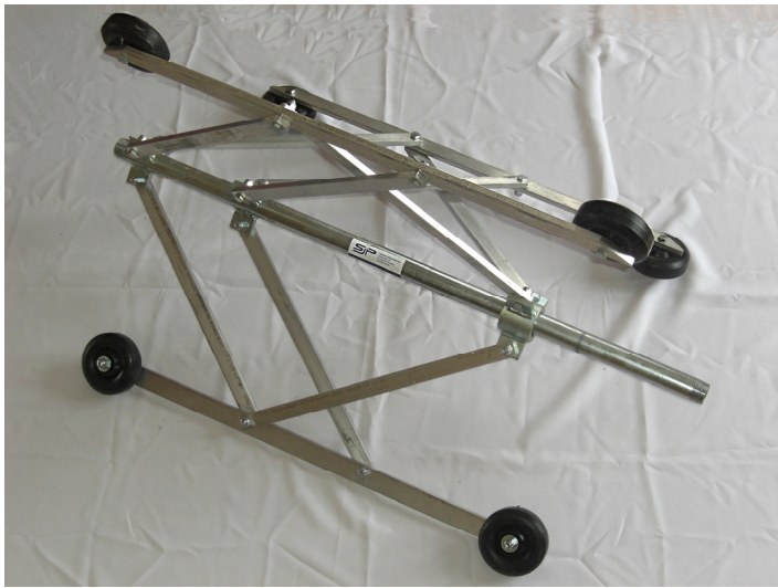
Largest diameter / größter Durchmesser / Grootste diameter